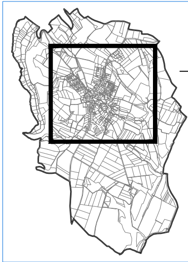
SCHEMA KATASTRU 1 : 50 000